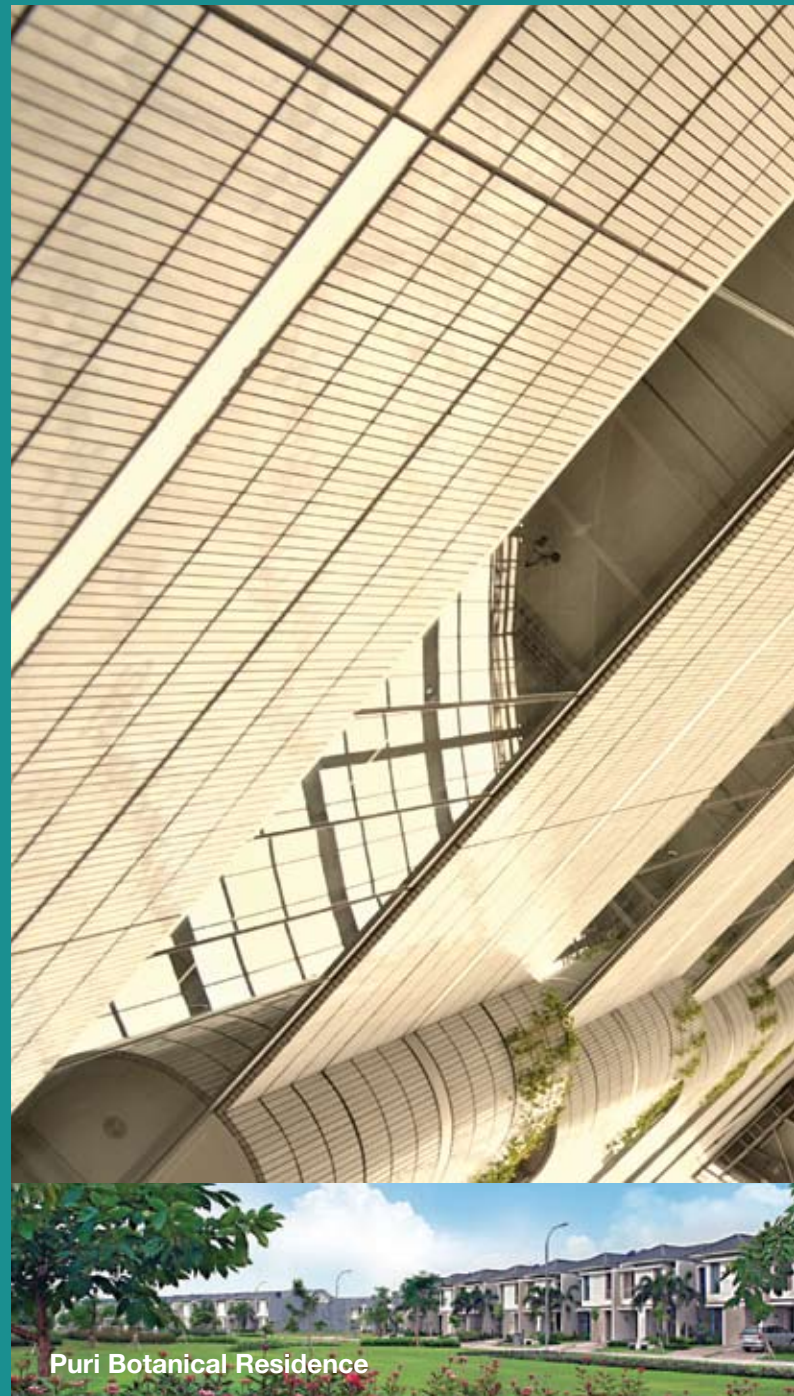
Puri Botanical Residence