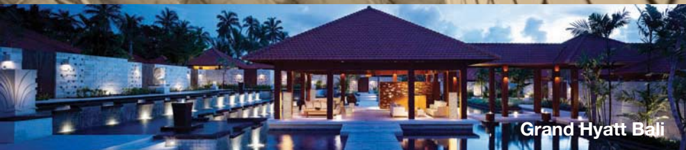
Grand Hyatt Bali